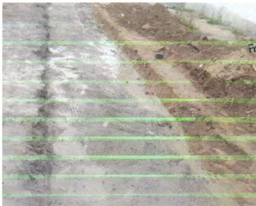
Foto 06 - CONCRETO