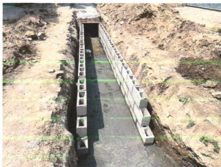
Foto 04 - ALVENARIA DE BLOCOS DE CONCRETO ESTRUTURAL 14X19X39 CM, (ESPESSURA 14 CM) FBK = 14,0 MPA, PARA PAREDES COM ÁREA LÍQUIDA MENOR QUE 6M 2 , SEM VÃOS, UTILIZANDO PALHETA. AF_12/2014