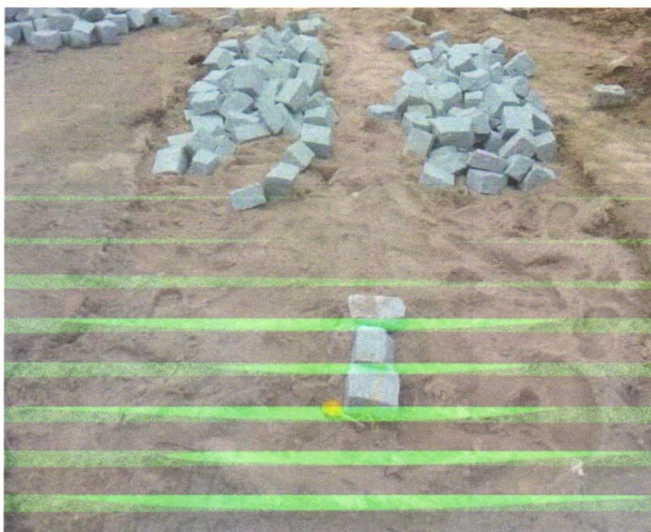
Foto 03 - ATERRO MANUAL COM SOLO ARGILO-ARENOSO IMPORTADO E COMPACTAÇÃO MECANIZADA EM CAMADAS DE 0,20 M NO MÁXIMO