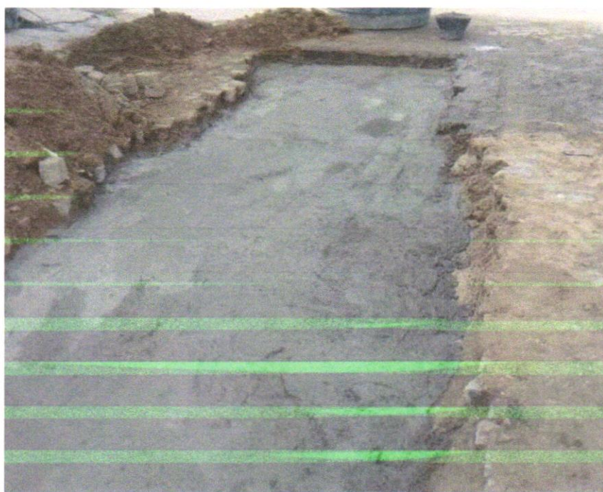
Foto 05 - CONCRETO